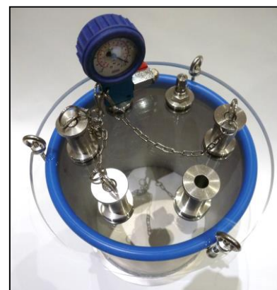
Рис. 4: Вид сверху