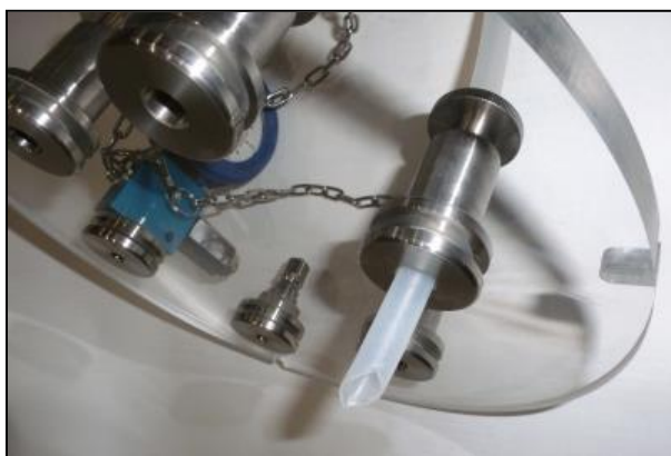
Рис. 3: Открытая крышка с зажатой трубкой