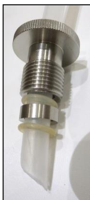
Рис. 2: фитинг