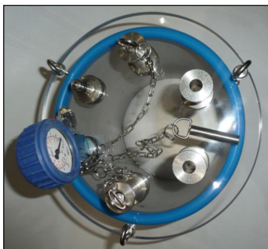
Рис. 5: Вид сверху