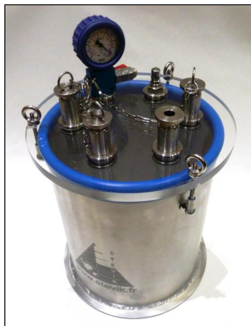
Рис. 1: SK3VAC-15L0WR12x4