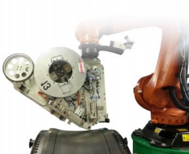
Роботизированная сварочная установка ультразвуковой нож на работе