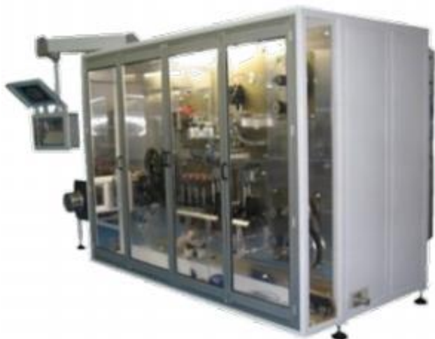
Десятикоординатная цифровая установка с семью системами ультразвуковой сварки