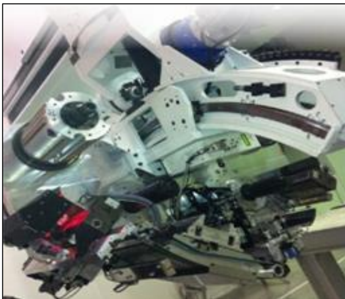
Ультразвуковой нож на цифровом устройстве управления