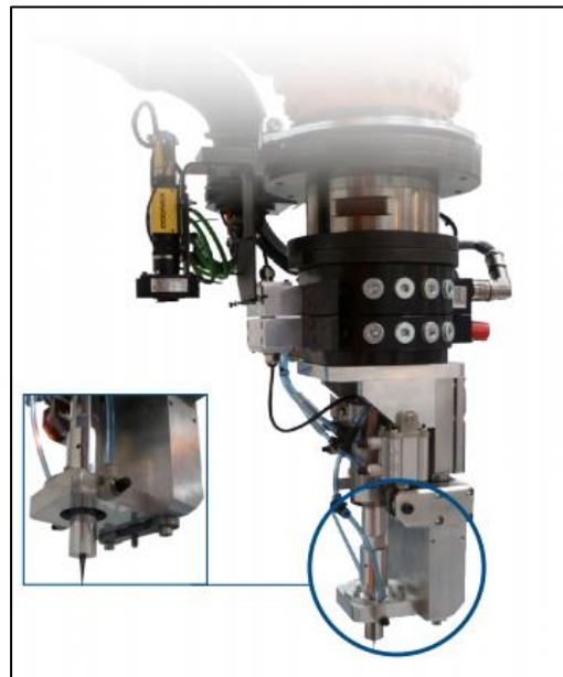
Ультразвуковой нож на работе