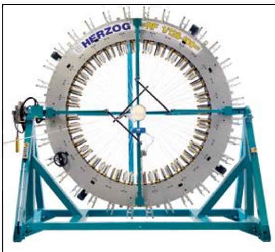
Плетельная машина радиального типа на 128 веретён

Конструкция машины, система управления и программное обеспечение обеспечивает работу машины с отдельно стоящим вытяжным устройством оправки мультироликового типа и многоосевым манипулятором на базе робота КУКА по строго запрограммированному алгоритму.