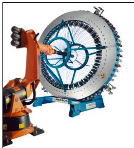
Плетельная машина радиального типа на 144 веретена с многоосевым манипулятором

Количество плетельных веретен, перемещаемых крылатками при плетении выбирается заказчиком в зависимости от размера и сложности изготавливаемой преформы и может варьировать от 48 до – 288 штук.